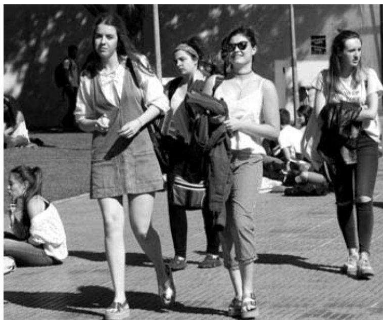
Un grupo de alumnos tras los exámenes en la UPNA de estos días. BUJENS

Las revisiones comienzan hoy Ahora, los estudiantes que deseen solicitar una segunda co-